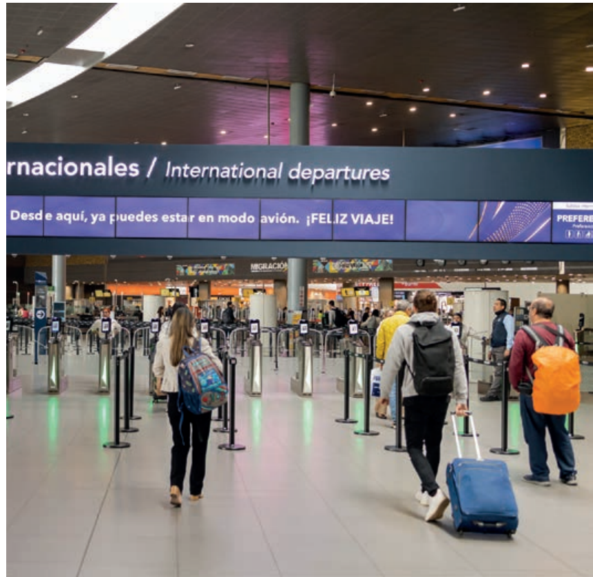
Aeropuerto El Dorado Bogotá

Inversión consciente: contamos con un proceso de evaluación de oportunidades de inversión o desinversión, que adicional a los criterios financieros, tiene en cuenta elementos ambientales, sociales y de gobierno (ASG) para la toma de decisiones.