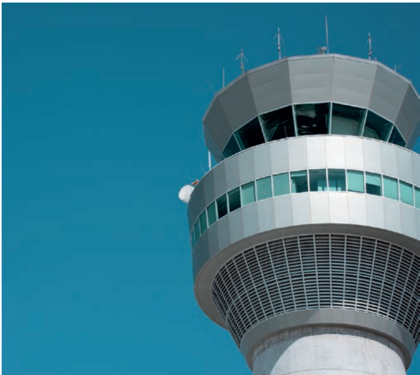
Torre de control Aeropuerto Mariscal Sucre Ecuador

El proceso de priorización que nos permitió establecer nuestras palancas incluye cinco pasos: