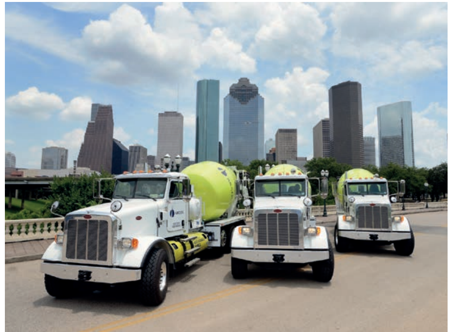
Mixer de Cementos Argos Estados Unidos

El marco de sostenibilidad en la organización está definido por la Política de Sostenibilidad y se complementa con las prioridades expresadas como temas materiales transversales del Grupo Empresarial Argos. Para su definición se tuvieron en cuenta los asuntos materiales de Grupo Argos como gestor de inversiones de activos de infraestructura (ver pág. 44 - 45) y los de sus negocios. Cada una de las compañías en el desarrollo de su proceso tuvo en cuenta la estrategia, los riesgos, un ejercicio de priorización y consulta a los grupos de interés y una visión amplia sobre tendencias.