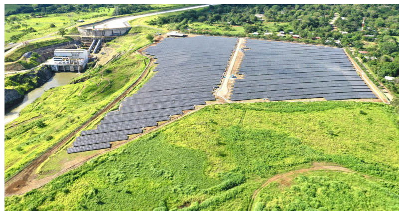
Celsia Solar Prudencia Panamá

El proceso de priorización que nos permitió establecer nuestros temas materiales consta de cinco pasos: